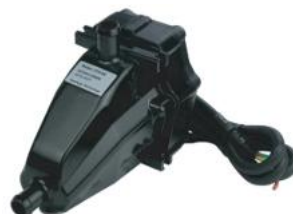
Sistema de precalentamiento Pro A-EGX-PCLTO/LIQ