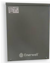
Sistema de transferencia automática (ATS) A-EGX-ATS