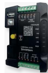
Módulo Wi-Fi A-EGX-WIFI