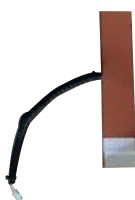
Sistema de precalentamiento A-EGX-PCLTO/AIRE